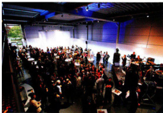
Foto 1: Fix fertig – Das Porsche Zentrum entstand in gerade mal neun Monaten.