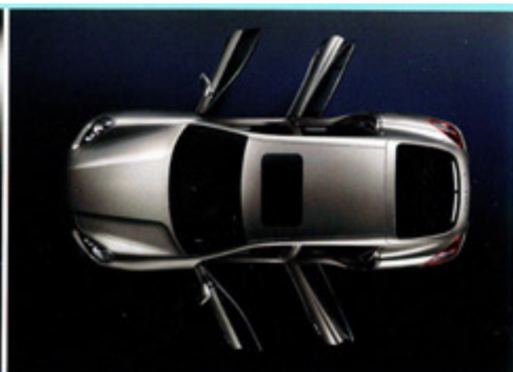
Unterwegs nach Mainz: Der neue Star aus Zuffenhausen heißt Panamera

Deren Interesse weckte zur Premiere nicht einer der zahlreichen Klassiker aus der Porsche-Schmiede, sondern der neue Star des Hauses: Der Panamera, der neben dem 911, den Mittelmotormodellen Boxster und Cayman sowie dem sportlichen Geländewagen Cayenne die vierte Porsche-Baureihe darstellt. In einem einzigartigen Gran-Turismo-Konzept verbindet er erstmals